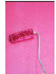
2.krs levitys tellalla