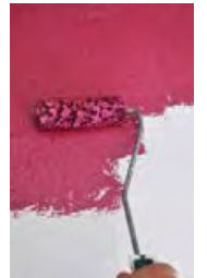
1 krs levitys telalla